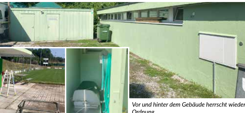
Vor und hinter dem Gebäude herrscht wieder Ordnung

Der Etzliberg ist zwar nicht neu, aber es sieht wieder frisch aus und kann mit gutem Gewissen für Spiele und Trainings bereitgestellt werden.