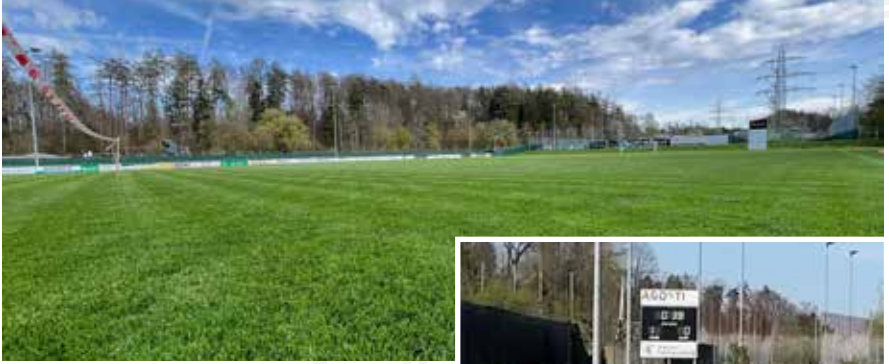
Oben: für die nächste Partie bereit – Das Feld ist gemäht, gestriegelt und markiert. Links: im Etzliberg wurde renoviert.