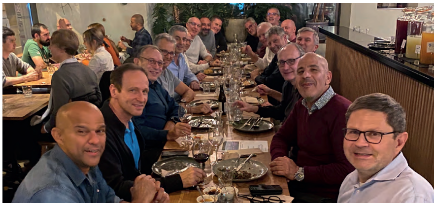
Die Senioren geniessen das Essen im Restaurant Saigon beim Bahnhof Selnau

rauf und anstelle dessen den erwartet weniger intensiven Wettkampf in der Regionallrunde entschieden. Es ist aber schön zu sehen, dass sich insbesondere die jüngeren Spieler im Team perspektivisch gern weiter nach oben orientieren möchten. Auf der Basis und auch mit der Aussicht, ein bis zwei Spieler des Jahrgangs 1974 in der Rückrunde langsam integrieren zu können, ist die Aufgabe von Team, Trainern und Fans (ja, auch die hat es, mit einem kleinen regionalen Übergewicht aus der Gattiker Ecke!) für 2024 klar: beständig den Wandel weiter-treiben und dabei die Energie der Jungen mit der konstanten Motivation der Älteren, die das Team so lange getragen haben, so zu paaren, dass möglichst alle Freude am Seniorenfussball haben – Hopp FCT 50+!