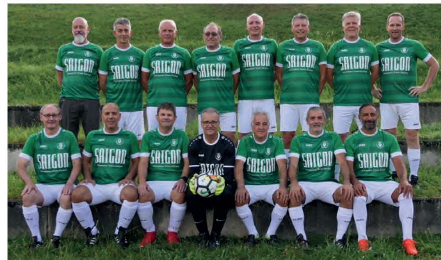
Neue Tenues für die Senioren 50+. Dank dem Sponsor kicken die Spieler wieder in Grün-Weiss

Die Wirkung der neuen Trikotfarben war im Übrigen sofort spürbar, und wir konnten die Winterpause mit einem beeindruckenden 2. Platz beenden – siehe separater Bericht. Wir schauen zuversichtlich und voller Enthusiasmus auf die kommende Saison, und selbstverständlich freut sich der Sponsor (saigon.ch) über Besuche im Restaurant in Zürich.